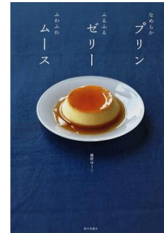
越野ゆうこ/著 家の光協会/版

定番のカスタードプリンのほか、冷やし固めるだけでかんたんに作れるプリン・ゼリー・ムースを紹介。旬のかぼちゃやさつまいもを使ったプリンも絶品です！