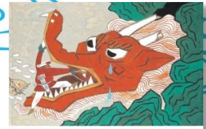
ほしになつたりゅうのきば

りゅうのけんかで天がさけてしまった。サンは、裂け目をつくろう方法を探しに行く。中国の民話。